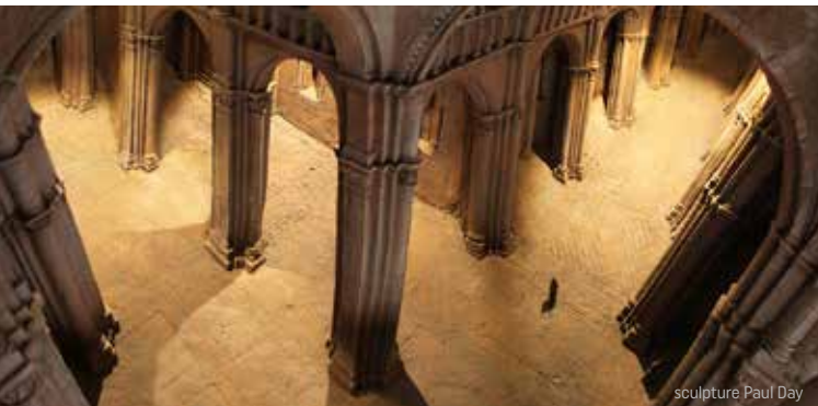
sculpture Paul Day

PAUL DAY , sculpteur anglais, exposition dans la chapelle