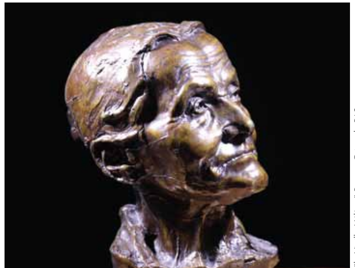
"la Vieille Hélène" Bronze

1913 : internement. On retiendra son dernier atelier quai Bourbon, où eut lieu son arrestation par deux infirmiers. En 1943 : décès de Camille après 30 ans d'internement pendant lesquels elle ne sculptera plus. Activité épistolaire très importante. Des liens profonds existaient entre Camille et son frère Paul Claudel, tous deux artistes : Camille réalisera plusieurs portraits de son frère dont le célèbre buste du jeune Romain.