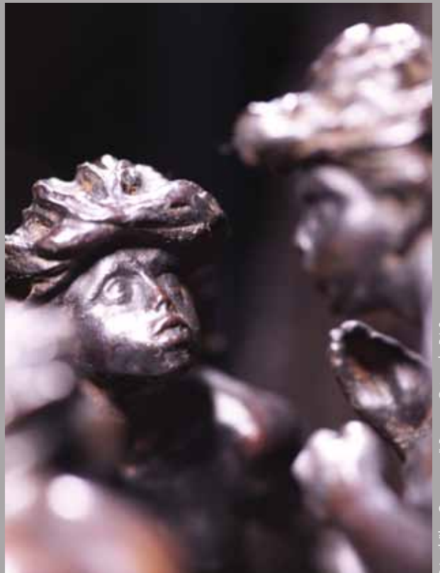
Détail "Les Causeuses" Bronze

En nombre, c'est le fonds le plus important au plan mondial. Les quarante œuvres exposées offrent une découverte complète de son parcours artistique. Parallèlement, le fonds constitutif du musée, fonds de sculptures, y compris monumentales, de la fin du XIXe siècle à la Première Guerre mondiale, donne à comprendre dans quel contexte artistique Camille Claudel s'est formée, a évolué, a dû s'affirmer. (Extrait site du Musée Camille Claudel.)