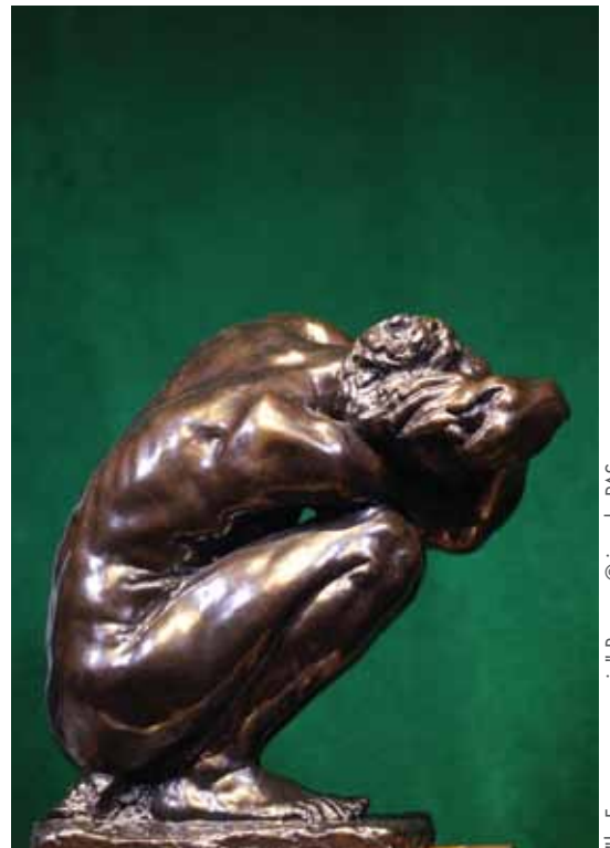
"La Femme accroupie" Bronze

Même année, départ d'Alfred Boucher en Italie, il est remplacé par Rodin. Les premières œuvres que Camille Claudel montre à Rodin lui font forte impression : le buste de La Vieille Hélène, au réalisme pathétique, et Paul à 13 ans, traité dans un style plus classicisant. Recevant au début des années 1880 ses premières commandes importantes, Rodin s'entoure alors de praticiens afin de se constituer un atelier, que Camille Claudel intègre vers 1884. Elle réalise surtout des morceaux difficiles (mains, pieds, destinés aux figures monumentales, en particulier La Porte de l'Enfer). Elle pose aussi pour lui.